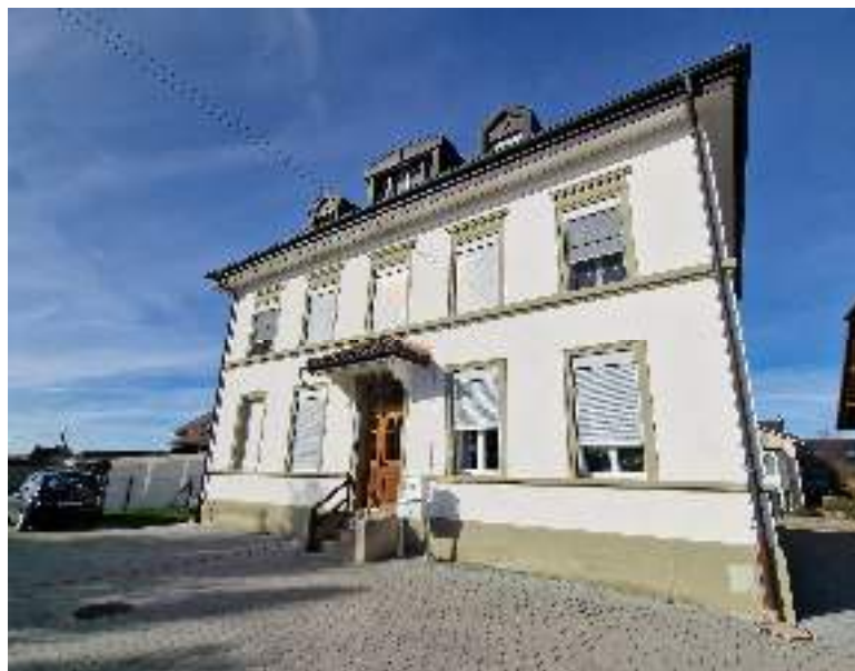
Cormérod - Route de l'École 10